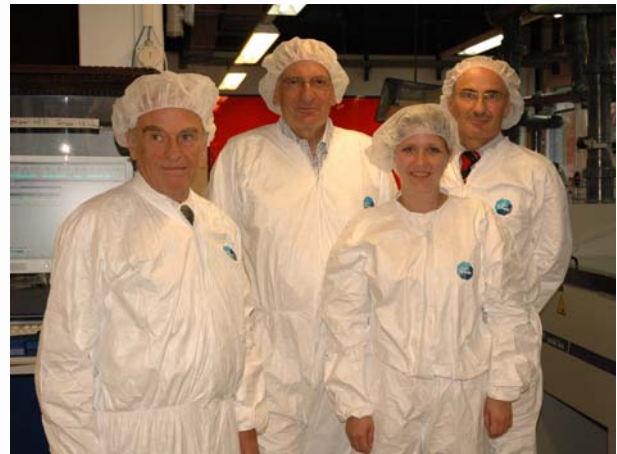
Ganz in Labor-Weiss: Die Bundesräte Hans-Rudolf Merz und Pascal Couchepin mit Nationalrätin Christa Markwalder und Fraktionschef Felix Gutzwiller (v.l.)

Für Varioprint AG war es eine grosse Ehre, gesamtschweizerisch Beachtung zu erfahren und sich von der besten Seite präsentieren zu dürfen.