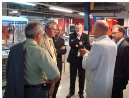
Äusserst interessierte Besucher auf dem Firmenrundgang