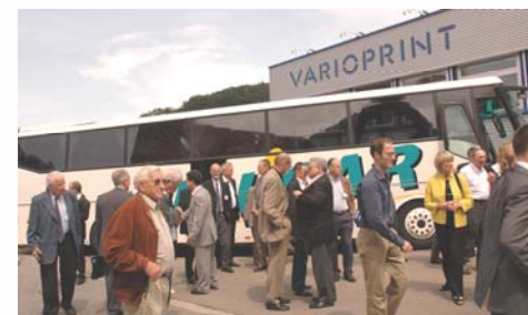
Ankunft der 120 Gäste aus Bern