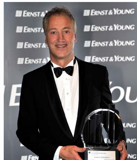
Die begehrte Trophäe...