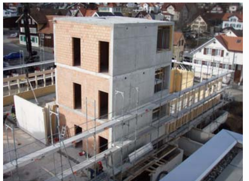
Treppenhaus, an dem der Fertigbau aus Holz "aufgehängt" wird

In der Folge ergibt sich durch die frei werdenden Büros im Werk 1 die Möglichkeit, die Abläufe zu verbessern und neue Anlagen im Hinblick auf noch höhere Kundenanforderungen zu installieren.