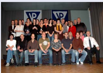
Die glücklichen und verdienten GewinnerInnen des Goldvrenelis

Traditionell wurde die Varioprint Belegschaft wiederum zur Abschlussfeier ins Hotel Restaurant Krone eingeladen. Mehr als einhundert Mitarbeitende kamen für gemütliche Stunden zusammen, genossen das abwechslungsreiche Unterhaltungsprogramm und das köstliche Buffet. Einmal mehr wurden an die 50 Mitglieder des VP-Teams mit einem Goldstück, dem sogenannten Goldvreneli ausgezeichnet für eine lückenlose Präsenz, ohne Absenzen, während des vergangenen Jahres. Die einmalige Stimmung im Saal, es wurde bis 02.30 Uhr getanzt und die Stunden danach in der Bar zeugten von der Unternehmenskultur, dem Teamgeist und dem Zusammenhalt in der Belegschaft - ein unschätzbare Wert in der momentanen Zeit und für die Herausforderung im kommenden Jahr.